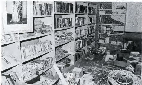
De bibliotheekruimte is nog een chaos.

Gelijk toen de verbouwingen aan het Tarcisiuscollege begonnen, werden opnieuw enthousiaste geluiden over een nieuw gebouw gehoord. Het oude E.E.G.-project werd